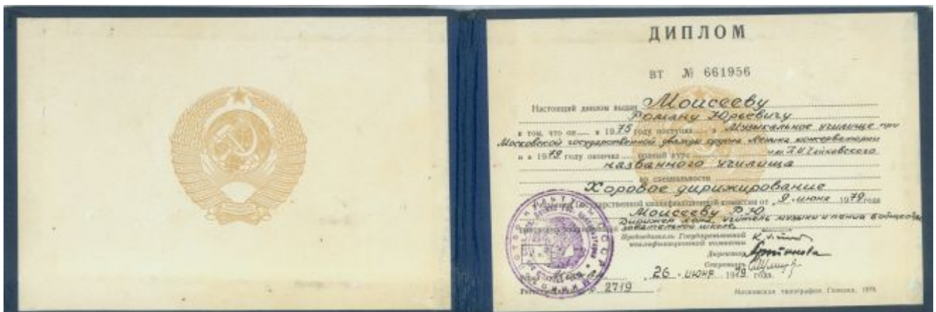
Диплом об окончании Академического музыкального училища при Московской государственной консерватории имени П.И. Чайковского. 1975-1979/