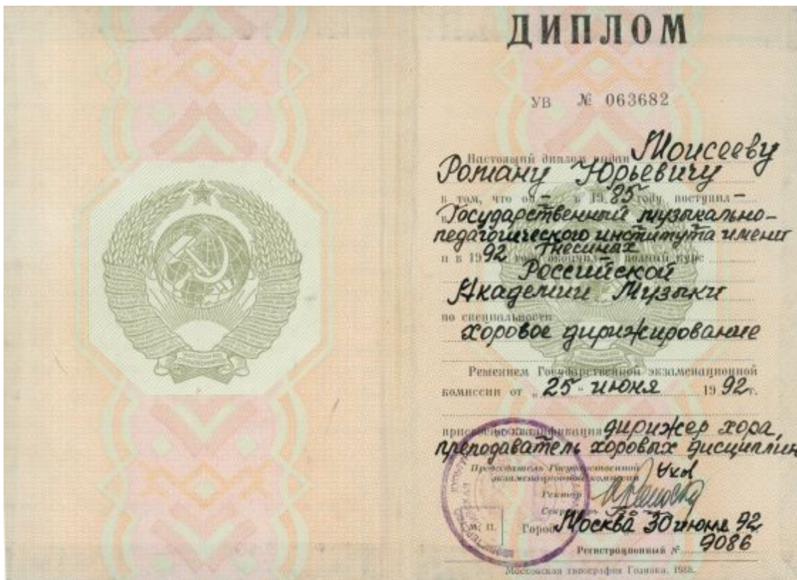
Диплом об окончании Российской Академии Музыки имени Гнесиных. 1985-1992.