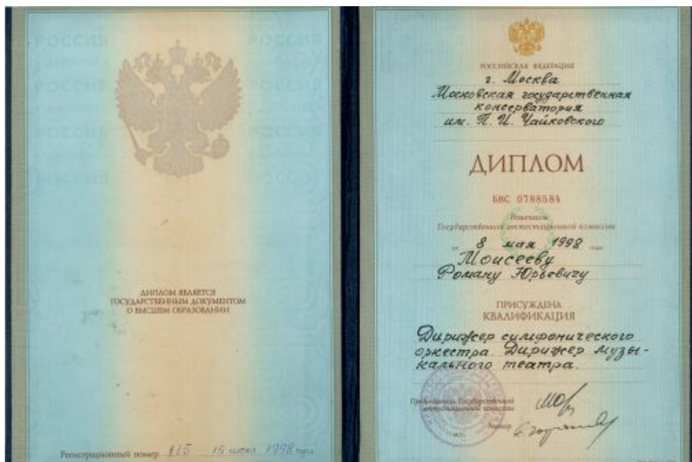
Диплом об окончании Московской Государственной консерватории имени П.И.Чайковского. 1994-1998.