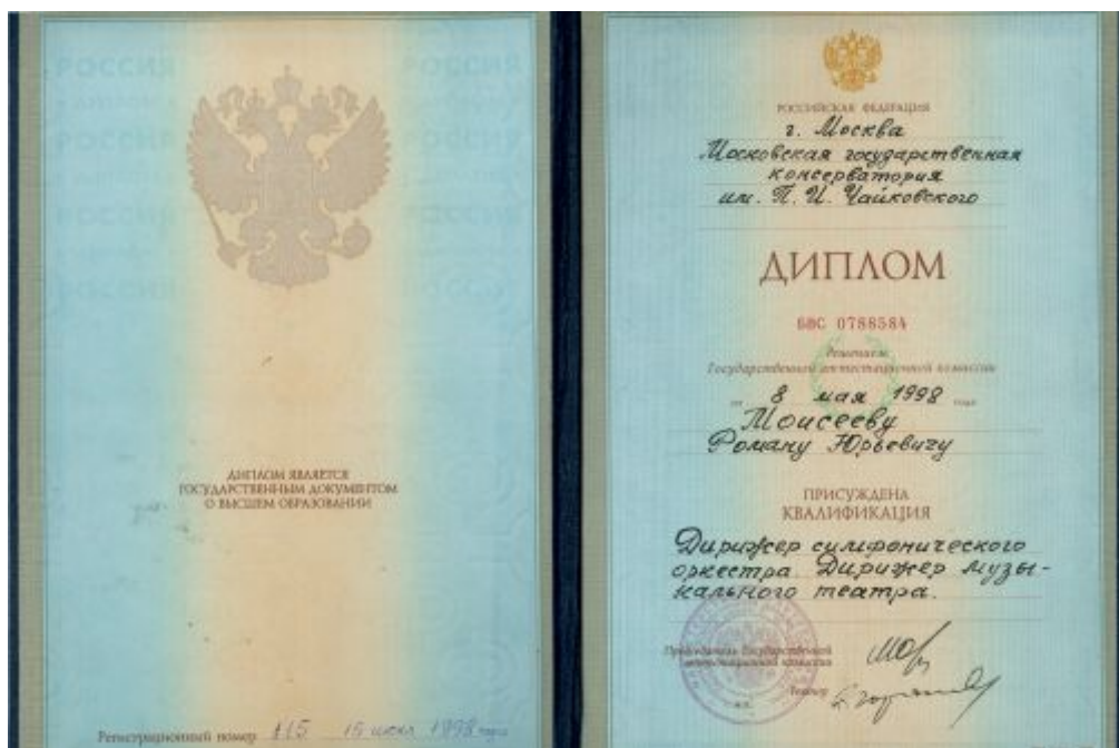
Диплом об окончании Московской Государственной консерватории имени П.И.Чайковского. 1994-1998.