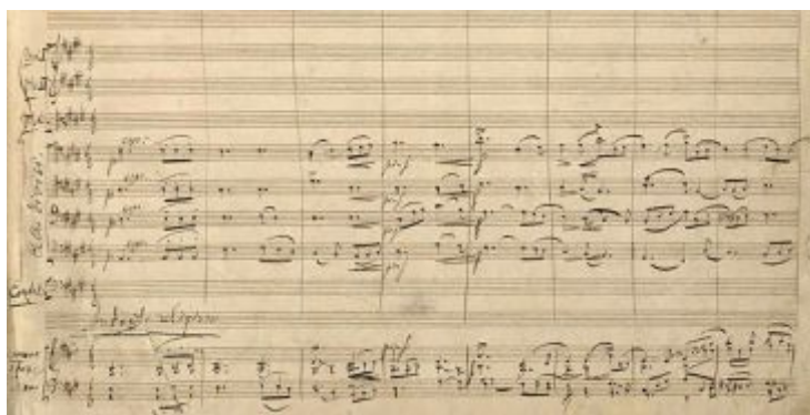
Манускрипт вступления к Кантате «Москва»