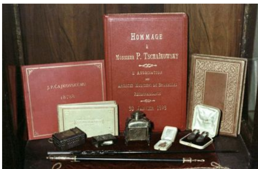
Дирижерская палочка и дирижерский жезл П. И. Чайковского

Необходимо отметить, что в современном мире нельзя недооценивать значительно выросший уровень исполнительского мастерства музыкантов и оркестров, что всегда может только приветствоваться... Главным же для дирижера всегда должны оставаться воспитываемые в коллективах верность композитору, стилю, творческая узнаваемость и сохранение великих традиций.